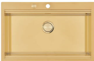
Fregadero Milanello Gold workstation 1034 059